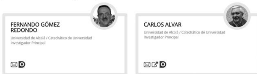
Fig. 6. Subapartado: Quiénes somos