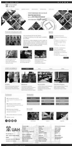
Fig. 1: <www.uah.es>