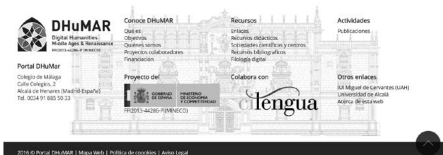
Fig. 5: Pie de página.

En el sub-apartado «Equipo» encontramos los Investigadores Principales del proyecto, los Investigadores y los miembros del Equipo de trabajo. Para agilizar la búsqueda aparecen unos recuadros con los nombres de cada uno, su afiliación, los enlaces principales y una fotografía (fig. 6). Al pinchar en el nombre, aparece una nueva página con un breve resumen de la trayectoria académica e investigadora de cada uno de los integrantes del proyecto (fig. 7).