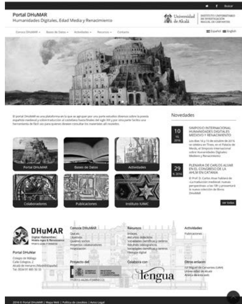
Fig. 2: <http://www3.uah.es/DHuMAR/>

Se trata de un diseño muy sencillo que evita en la medida de lo posible efectos tipo flash o java, para que no aparezcan problemas de visualización en los distintos tipos de dispositivos y para que sea accesible a personas con capacidades diferentes.