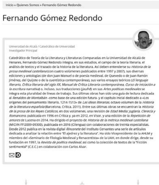
Fig. 7. CV breve.

Las otras pestañas son algunas de las bases de datos que conforman el portal. No son enlaces directos, sino breves explicaciones sobre las mismas 8 .