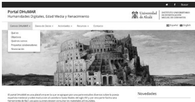
Fig. 3: Header DHuMAR

Tiene un header (fig. 3), o sea, una cabecera donde aparece el título y el logo del IEMSO.